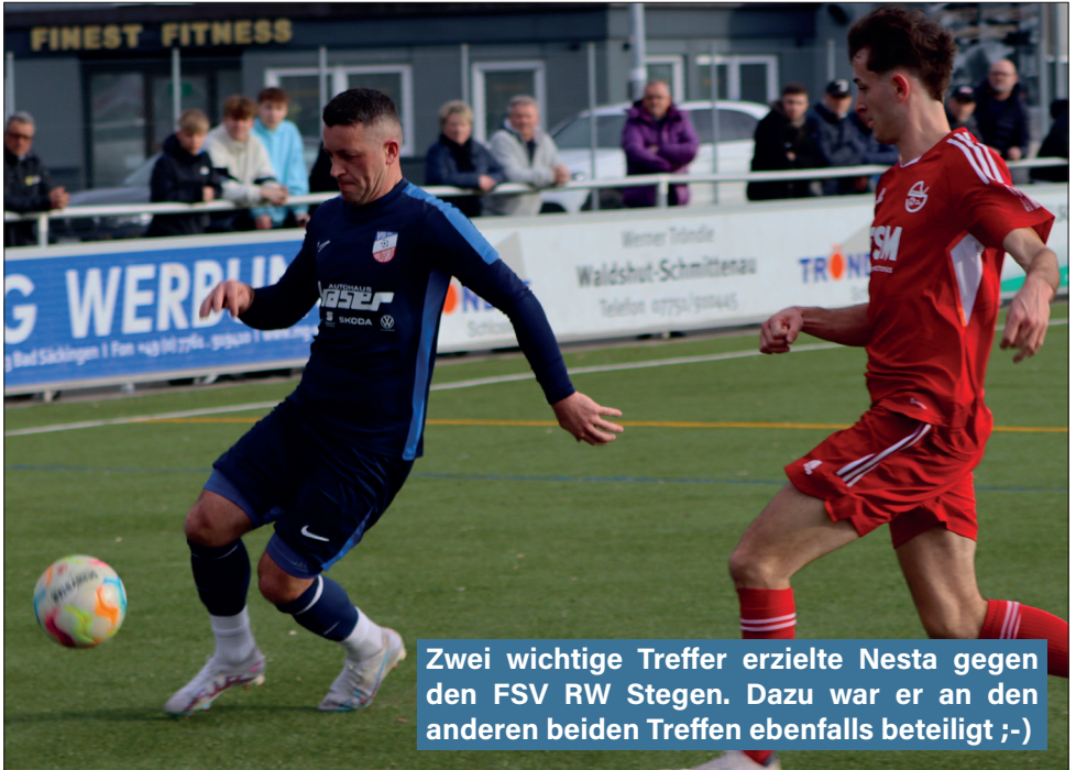
Zwei wichtige Treffer erzielte Nesta gegen den FSV RW Stegen. Dazu war er an den anderen beiden Treffern ebenfalls beteiligt ;-)